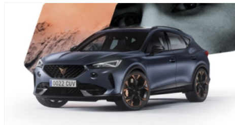
CUPRA Formentor. Drive another way.