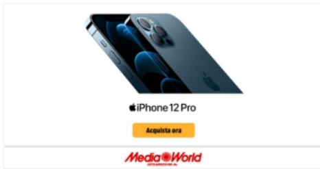
iPhone 12 Pro. La nuova era della velocità.