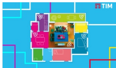
Con TIM SUPER FIBRA connetti la tua casa!